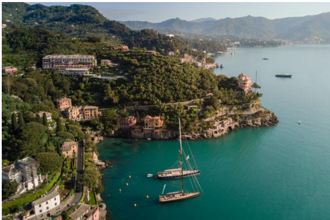
Vue de la baie de Portofino.